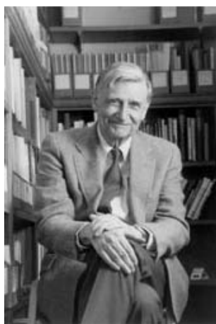
Edward O. Wilson, der har sat skel i biologien på linje med Darwin.

En anden side af den medfødte adfærd er med Wilsons ord xenofobien: ”Da personlig velkendthed og fælles interesser er