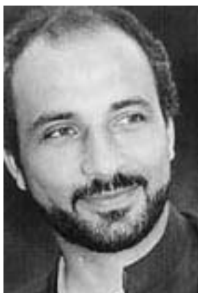
Tariq Ramadan, ledende talsmand for den farlige illusion ”euro-islam”

Tariq Ramadan. Han må dog konkludere, at også Ramadan gør accept af vestlige samfundsforhold betinget af overensstemmelse med koranen. Muslimerne vil pr. definition ikke underkaste sig vor samfundsorden. Ikke overraskende kan Pittelkow fra avisen Die Welt referere en