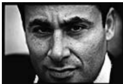
Almajid og Khader - to ulve i fåreklæder?

at gå ind for muslimernes mål om verdensherredømmet. Det gør jo store fremskridt rundt omkring.