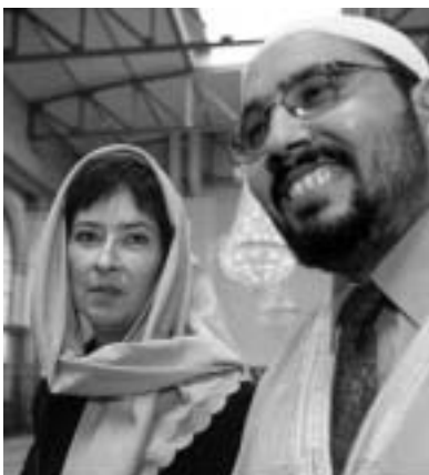
Mona Sahlin fører an i den svenske politiske korrekthed, her ved et "kulturmøde" med iranere.