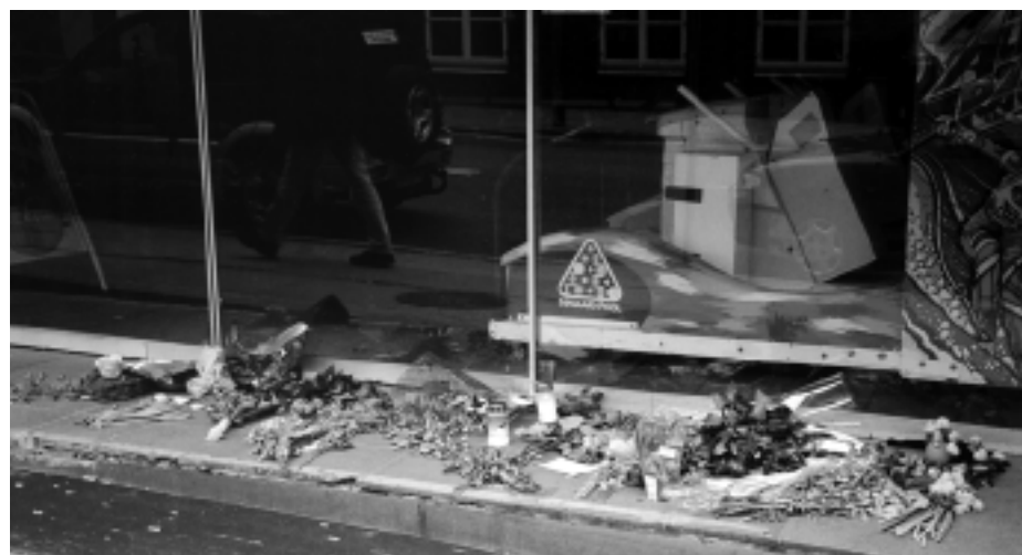
Blomster ved mordstedet i Roskilde.

Siden blev der af medie-mafiaen tilsyneladende lagt totalt låg på sagen – vel sag-tens for ikke at forurolige de indfødte. Har nogle af DDF's medlemmer i Roskilde hørt om sagen?