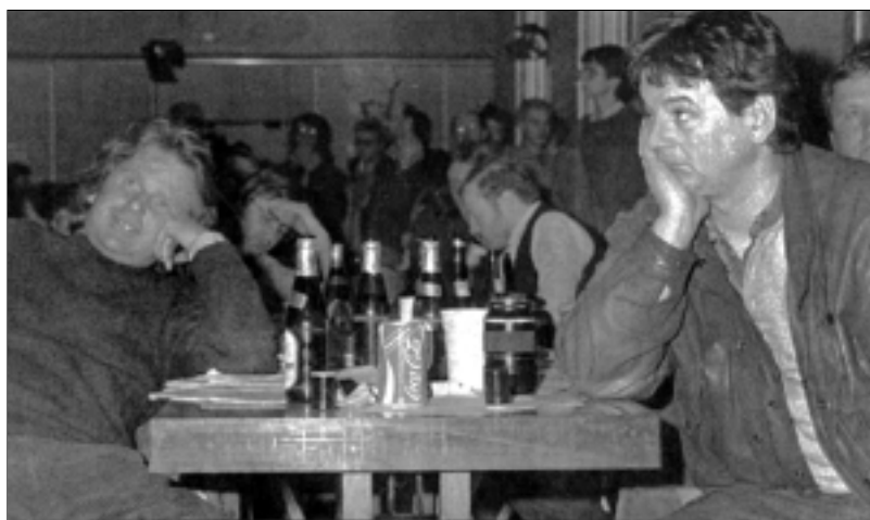
De overflødige par excellence: To ledende 68'ere, Daniel Cohn-Bendit og Joschka Fischer i 1987, ørkesløse mellem to projekter – efter marxismen, før multikulturalismen.