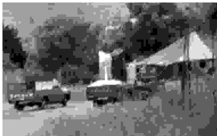
Sigøjnerlejr i Grækenland.

Sigøjnerne - eller på politisk korrekt kau- dervælsk: "Roma og Sinti" - er en frugt- bar stamme: Der er i dag op imod 8 mio. sigøjnere i Europa; i 1927 var der kun 1 mio. (Salmonsens Leksikon Bd. 25). Alle steder er de en pestilens for værtsbefolk- ningerne. I aviserne har der i de seneste år været mange indignerede reportager om