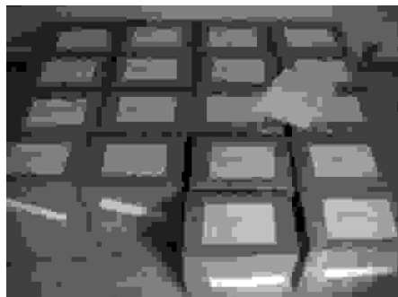
Danskeren på vej til Kosovo.

Fremragende! Fremragende! Vi følger med forhøjet beredskab den videre udvikling af dette glimrende initiativ.