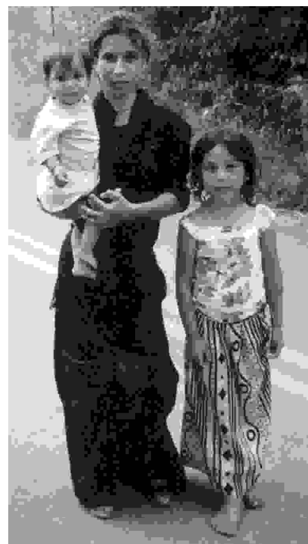
Sigøjnere i Grækenland

des forældres hus ned. Ud over sådanne sager kan nævnes usædvanlig grov sigøjner-kriminalitet i form af en familieklassens mishandling og voldtægt af en 17-årig pige i Varde gennem et halvt år, fordi hun ikke ville gifte sig og have børn med en søn af huset. (Ekstra Bladet 11/5 99).