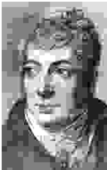
Den østrigske statsmand fyrst Metternich, der kom til at stå som den dominerende kraft bag "den hellige alliance" 1814-1848.

Længe har EU-propagandisterne søgt at fremføre Unionens demokratiske karakter som en garanti for dens respekt for medlemmernes egenart og hævdet, at den ikke ville blande sig i deltagerlandenes indre anliggender eller indenrigspolitiske