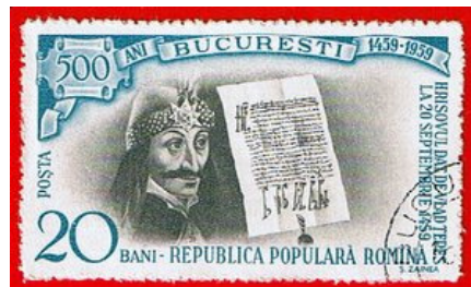
Rumænsk frimærke med nationalhelten Vlad Dracula

Vesteuropa er, at de fokuserer på Draculas påståede grusomhed, hvorimod de østeuropæiske fortællinger fremhæver hans heltemod og retfærdighedssans. I hjemlandet Rumænien anses Vlad Dracula for national helt.