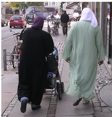
Velfærdskommissionen: Indvandrere fra mindre udviklede lande modtager i gennemsnit 2,6 millioner kr. mere over livsløbet, end de betaler til den offentlige sektor - svarende til en villa i whiskybæltet.