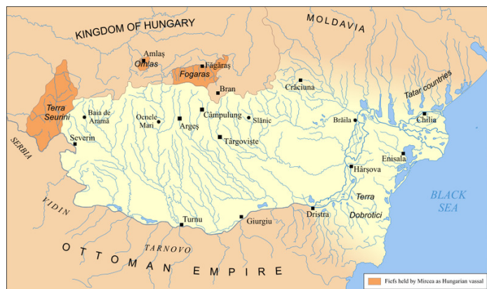
Valakiets beliggenhed mellem Ungarn og det Ottomanske Imperium

http://www.nielskpetersen.dk/vladtepes.php