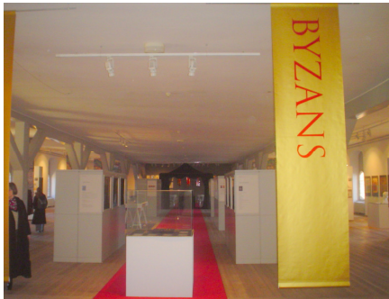
Fra udstillingen i Rundetårn om Det Byzantinske Rige

Indtil da hed byen Konstantinopel. Den var hovedstad i datidens mægtigste europæiske rige, Det Byzantinske Rige, også kendt som det Østromerske Rige som eksisterede fra 330 til 1453.