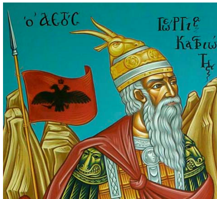
Gjerg Kastrioti - Skanderbeg - med Kastrioti-familiens våbenskjold - den dobbelthovedede ørn, som i dag indgår i Albaniens flag.

Gjerg udmærkede sig i tyrkernes tjeneste og steg hurtigt i graderne til "beg", som betyder general. Tyrkerne gav ham da tilnavnet Skanderbeg, som betyder General Alexander - en smigrende hentydning til Alexander den Store.