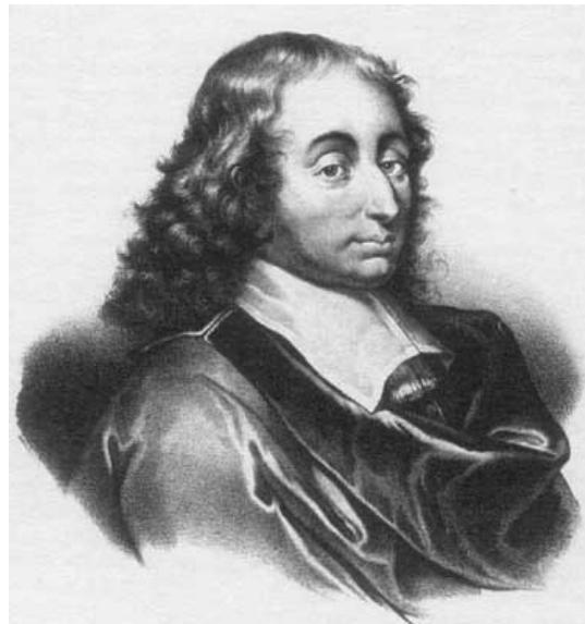
Blaise Pascal (1623–1662), fransk matematiker, fysiker og filosof. For ham var forskellen mellem kristendommen og islam i en nøddeskal denne: ”Jesus lod sig myrde; Muhammed lod myrde.”

For islam er i virkeligheden en teokratisk eller gudsstyret totalitarisme, der skriftligt gør krav på verdensherredømmet. Først når verden ifølge islams sam-