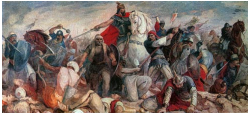
Den kristne stridsmand Gjerg Kastrioti Skanderbeg og hans folk giver de aggressive tyrkere nogle vel fortjente prygl.

for at støtte kristne styrkers belejring af byen, fandt Moses en undskyldning for ikke at deltage og blev tilbage for at lægge planer imod Skanderbeg.