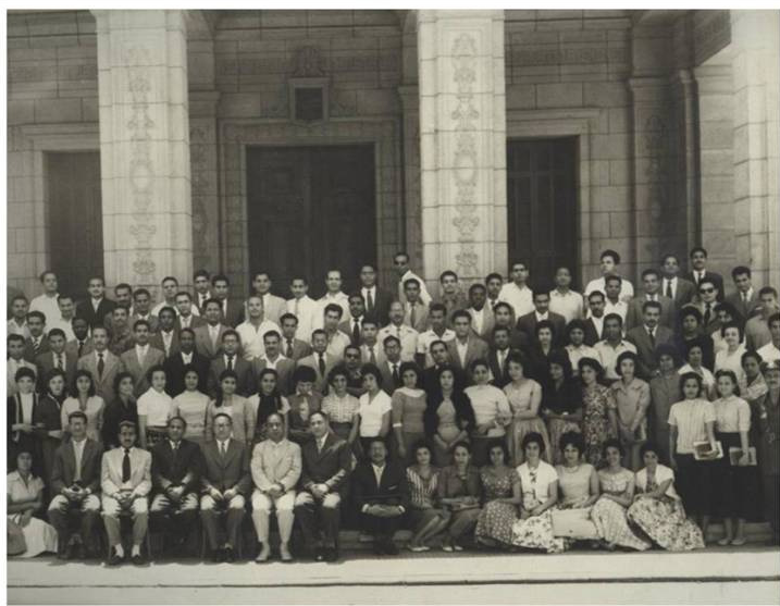
1959: 71. plads

På et fremtidigt billede vil pigerne måske være iført burka, - hvis det overhovedet får lov at komme på universitetet, og så kan Egypten måske nå ned på niveau med Afghanistan omkring en 170. plads.