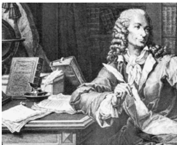
Francois Voltaire (1694-1778), fransk digter, forfatter og filosof. Om islam og muhammedanerne stillede han sig spørgsmålet: ”Hvad skal man svare et menneske, der siger til én, at han hellere adlyder Gud end mennesker, og tror at komme i himlen, hvis han kvæler én?”

“I troende! Kæmp mod de vantrø i Jeres nærhed! De skal mærke, at I kan være hårde. I skal vide, at Allah er med dem, der frygter ham.”