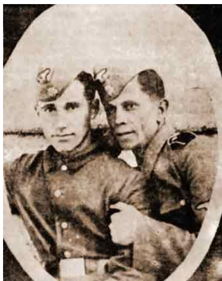
Kosovo-albanske medlemmer af SS Skanderbeg

Holbergs Helte- og Heltindehistorier. Genfortalt af Henrik Stangerup. København. 1987-88.