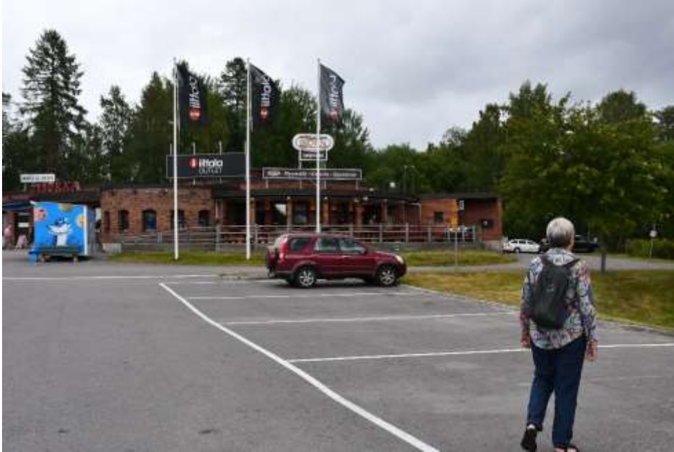
Et pausested, med lidt indkøb:

Kuopio har et rigt folkeliv med havn, gamle udflugtsbåde og markedsplads, men alt det gik vi glip af på grund af regn og dårlig sigtbarhed. Men fjernsynstårnet med restauranten i toppen skulle vi i al fald op i. Det gjaldt jo frokosten.