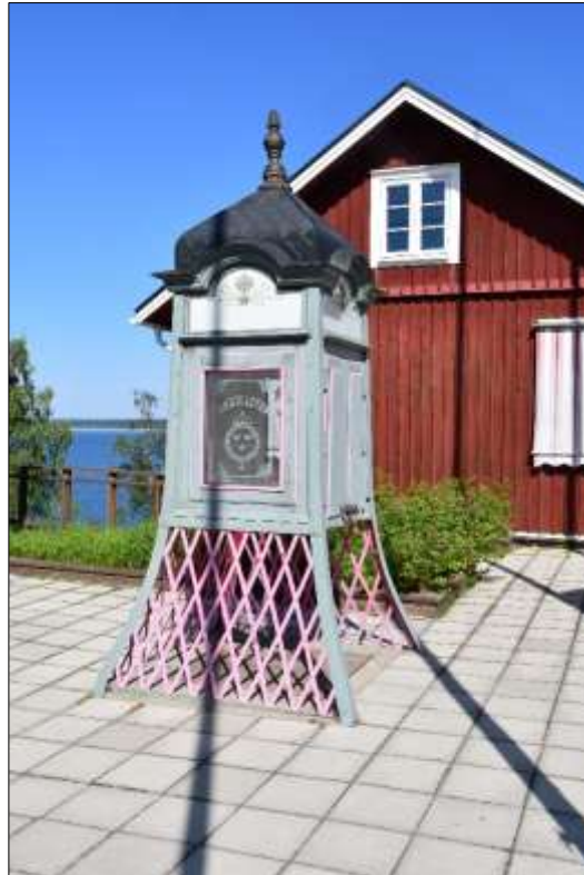
De gamle telefonbokse står mange steder, her Porjus