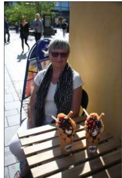
Dyre, vaflen fantastisk