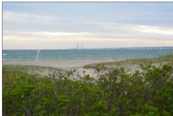
På vej, Sjælland forude

Vi har været i Stockholm mange gange, så det blev meget med gensynsglæde og så havde vi bestemt os for, at nu skulle Stadshuset besøges. Det var en rigtig god ide, kontorer for den politiske top og så store receptionslokaler, lidt imponerende. Ved banketter "55 cm til folket, de kongelige kunne få 60 cm stoleplads". Og så er det i cykelafstand fra Bredäng med fine cykelstier.