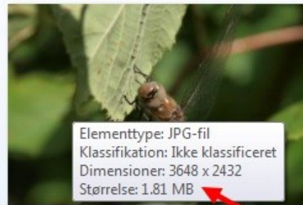
beskaaret til 3_2