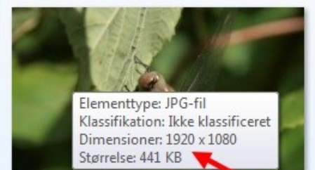
beskaaret 16_9 1920pixels

Her er billedet så yderligere beskåret til 16:9 format. I den fulde opløsning fylder det nu 1,53 MB. Hvis det reduceres i størrelsen til 1920 x 1080 som er HD format fylder det kun 441 KB