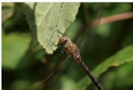
beskaaret til 3_2

Her billedet der er taget med mit Olympus E-520 kamera. Billedet i fuld opløsning fylder her 2,03 MB