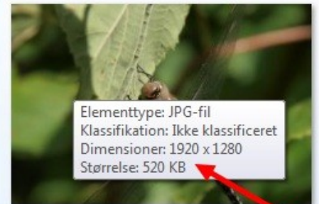
beskaaret til 3_2 1920pixels

Her er billedet beskåret til 3:2 format. Den fulde opløsning fylder nu 1,81 MB. HD format på tv-skærme er 1920x1080. Her er billedet så yderligere reduceret til 1920 pixels i bredden som tv'et kan vise. Nu fylder det så kun 520 Kb