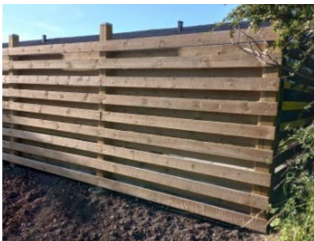
Vandret montering og mønster.