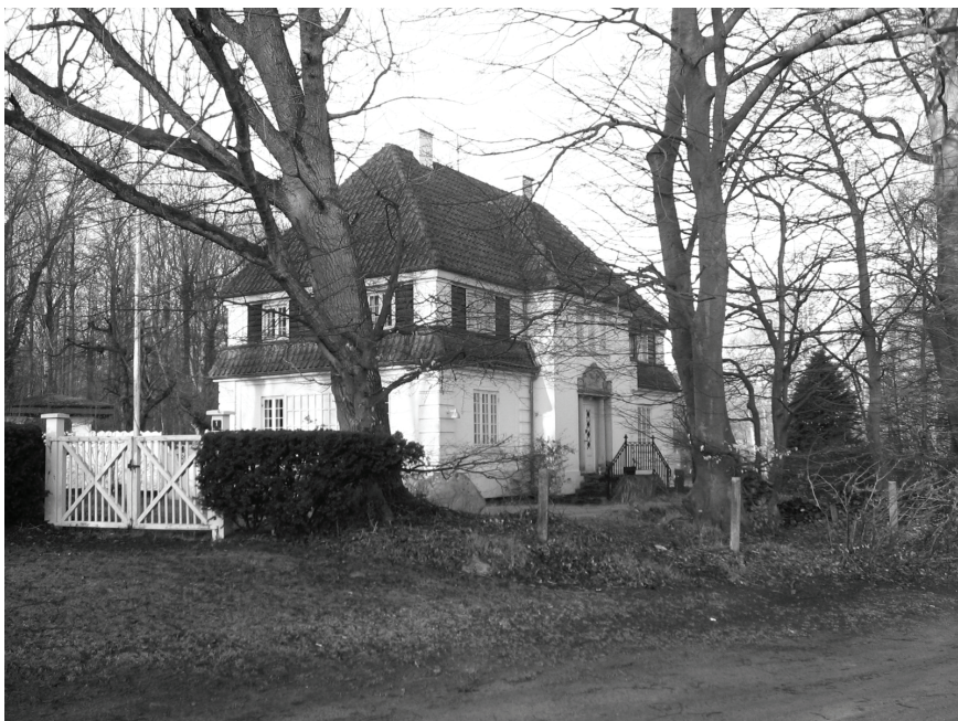
Sommerhytte for aristokratiet

Ved den efterfølgende besigtigelse af problemets omfang så jeg, at fundamentet for de 2 vandtønder bestod af mursten, knækkede fliser og rådne rafter. Hele herligheden klar til at styrte omkuld, når de 2 stk. 200 liters tønder blev fyldt